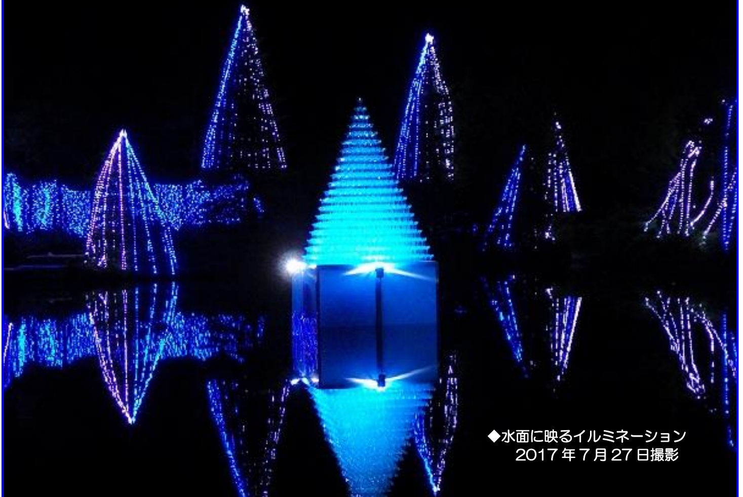
◆水面に映るイルミネーション 2017年7月27日撮影