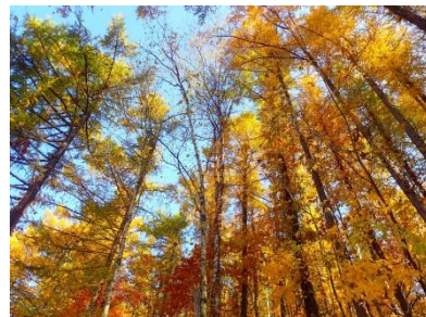
カラマツの黄葉（滝野の森 森の情報館周辺） 10.26撮影（右下は10.25撮影）