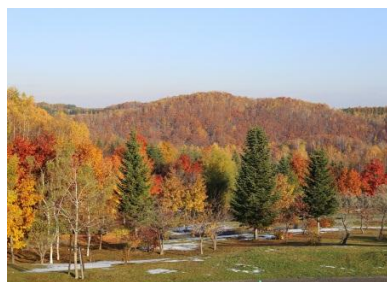
収穫の谷周辺 紅葉全景