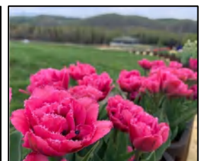
ディズニーランドパリ