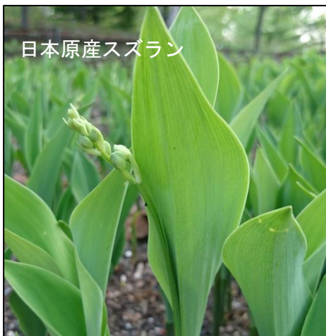
日本原産スズラン