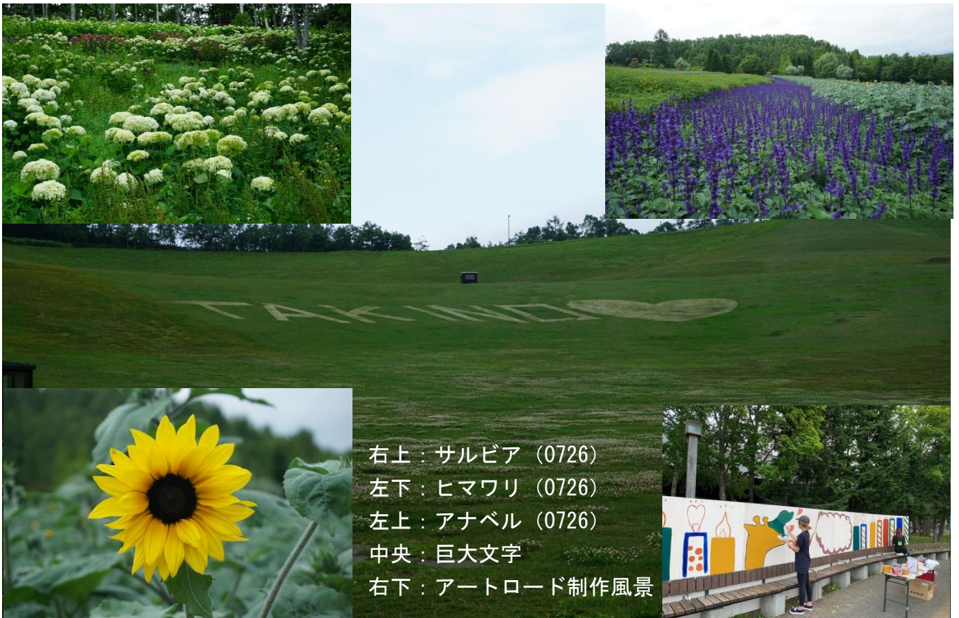
右上：サルビア (0726) 左下：ヒマワリ (0726) 左上：アナベル (0726) 中央：巨大文字 右下：アートロード制作風景

なお、謎解きイベントや昆虫野外博物館、滝野クラフト体験教室など、開園後のイベントは当初の予定通り行います。また、アナベルやサルビア、ヒマワリなどが現在(今後にかけて)見どころとなっております。例年以上に準備を入念に行ったイベントや花にご期待ください。