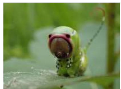
ナカグロモクメシャチホコ