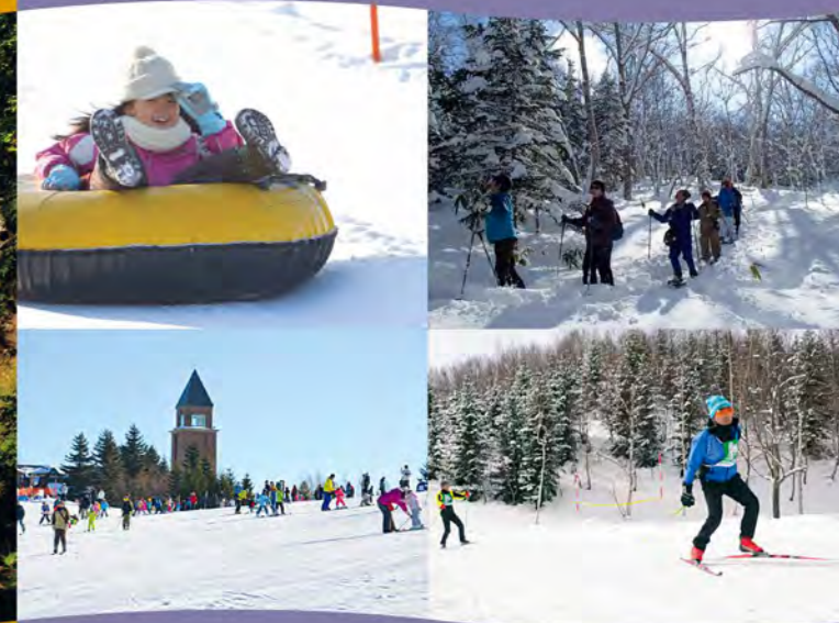
※詳情請參閱「瀧野白雪世界入園指南」。

冬天的瀧野搖身一變成為處處積雪的「雪中樂園」！可以體驗一口氣滑降200公尺的雪上橡皮艇，以及適合新手遊玩的滑雪場。另外，還可以穿上雪鞋悠遊步行在寧靜森林間，冬天的瀧野一樣充滿樂趣。