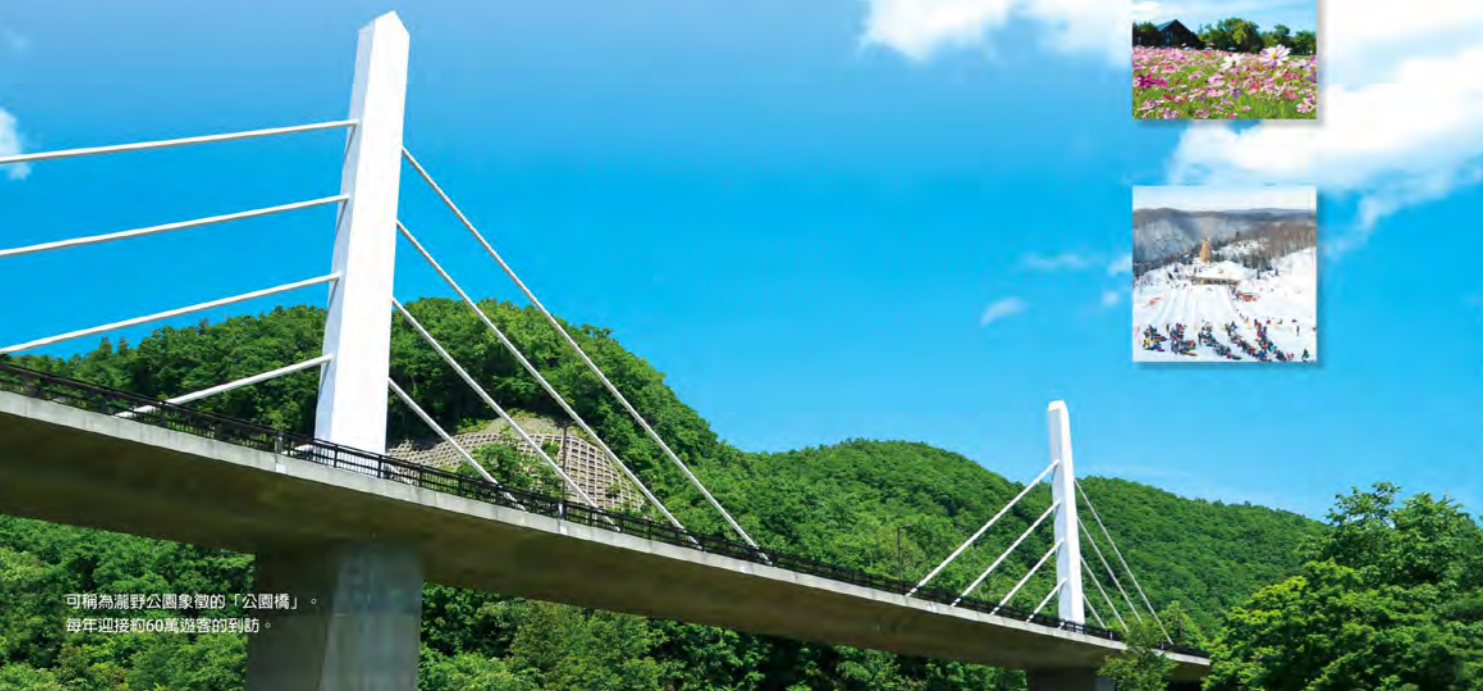
可稱為瀧野公園象徵的「公園橋」。每年迎接約60萬遊客的到訪。