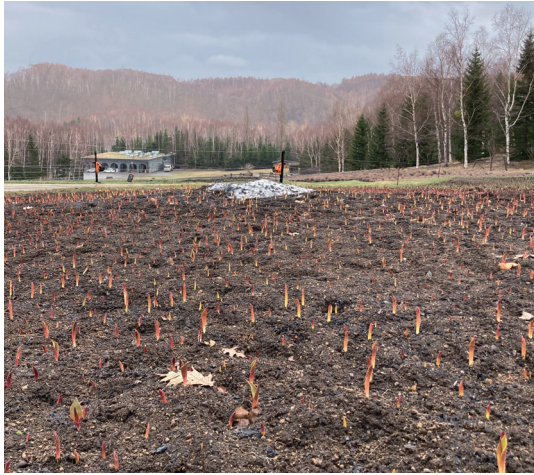
カントリーガーデン チューリップ 4/17 撮影

カントリーガーデンの一部に残雪がありますが、融雪が進んでいる場所では、チューリップの芽が出ている様子を見ることができます。 園内では156品種約25万球のチューリップが楽しめます。昨年は5/10前後から咲き始め、5/20頃には見頃になりました。 今年も5/10頃から咲き始め5月中旬頃から6月上旬頃に見頃を迎える見込みです。