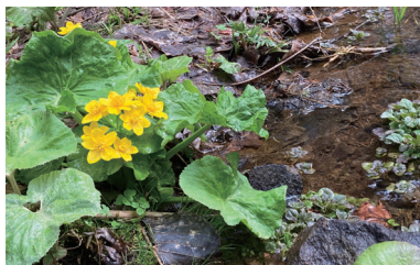
エゾノリュウキンカ 4/17 撮影

この時期にしか会うことのできない“春の妖精”の花々に会うことができます。 溪流ゾーンの「平成の森」周辺ではエゾエンゴサクやカタクリなどの春を告げる花々が4月下旬にかけて咲き始めます。 ※残雪により開花時期が変わる可能性があります。