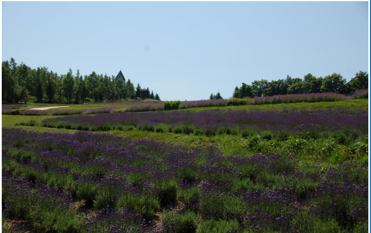
撮影：平成 29 年 7 月 13 日

カントリーガーデンでは約 3,000 株のラベンダーが花穂を伸ばし、例年より 10 日ほど遅れて開花が始まりました。一部報道でも伝えられているとおり、滝野公園でも一部の株が枯れてしまいました。しかし、残り株については順調に生育しており、今年も滝野公園を涼しげな紫色の花で彩ってくれそうです。20 日頃から見頃となり、今月末までご覧いただけると見込んでおります。北海道を代表する夏の花を是非ご紹介下さい。