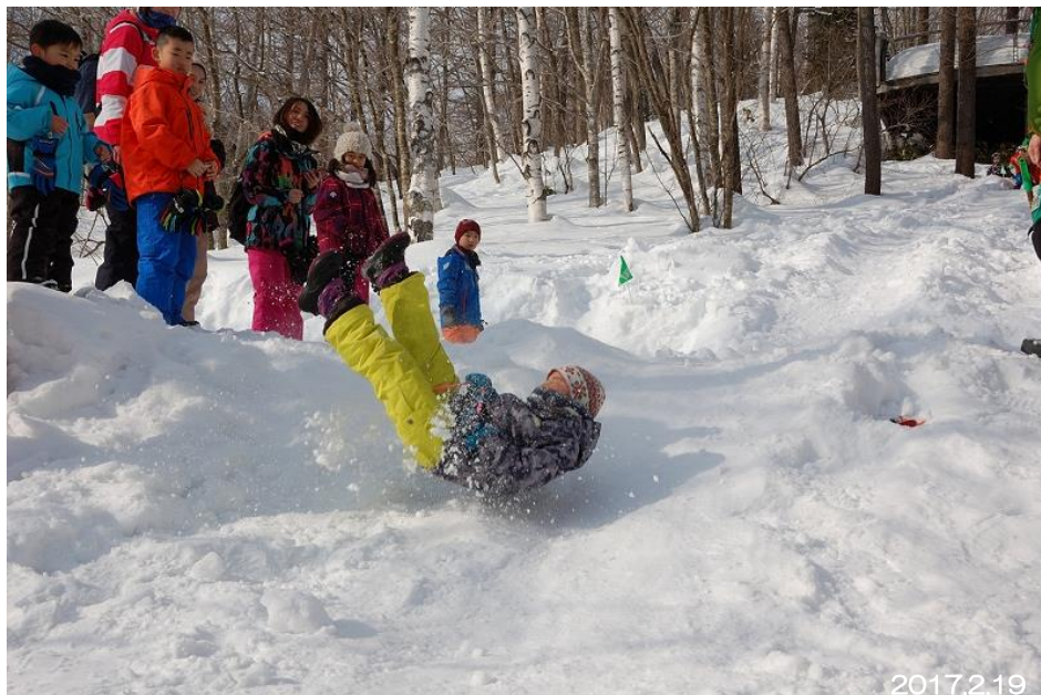
滝野の森 森フェス“尻すべり選手権”

ご多忙中のことと存じますが、取材並びに記事掲載のほど、よろしくお願い申し上げます。