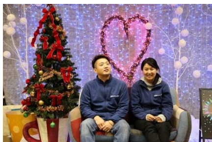
12/23～25 限定の“クリスマスフォトスポット”も登場