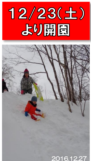
はじめての森遊び