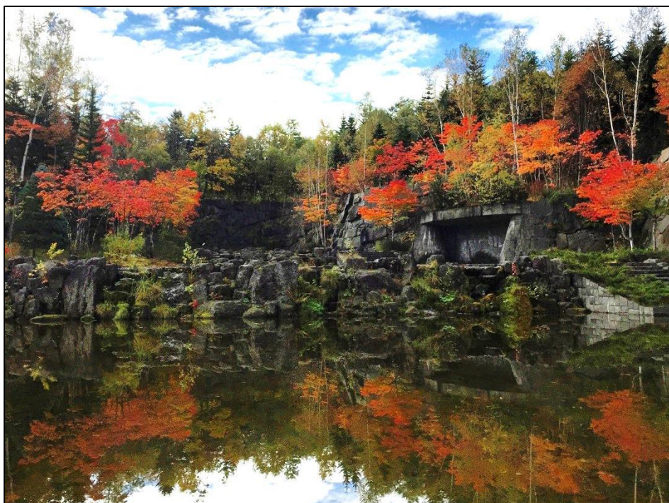
昨年の紅葉水鏡の様子

つきましては、 11日金曜日に内覧会 を行いますので、ご興味のある方はお越しください。